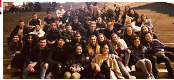
▶ Studiereis Berlijn