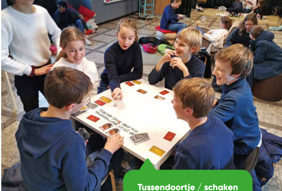
Tussendoortje / schaken