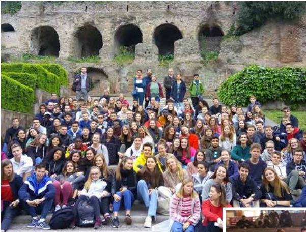
▶ Studiereis Italië